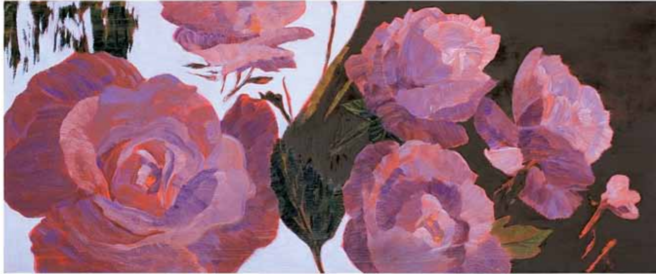
Kukat todella näkyvät The flowers really see 2010 öljy kankaalle oil on canvas 50 x 100 cm