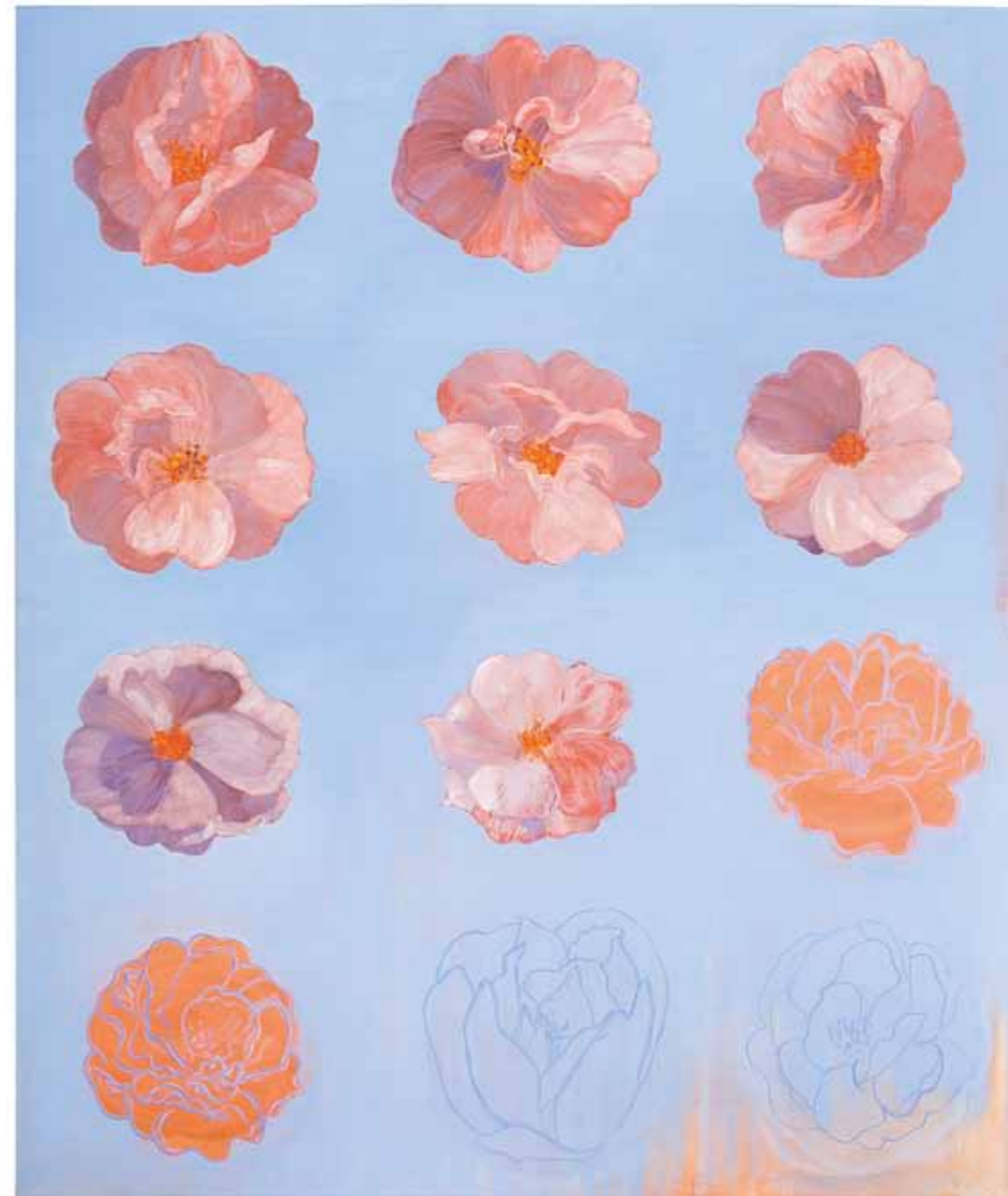
Armo I Mercy I 2010 öljy kankaalle oil on canvas 175 x 150 cm