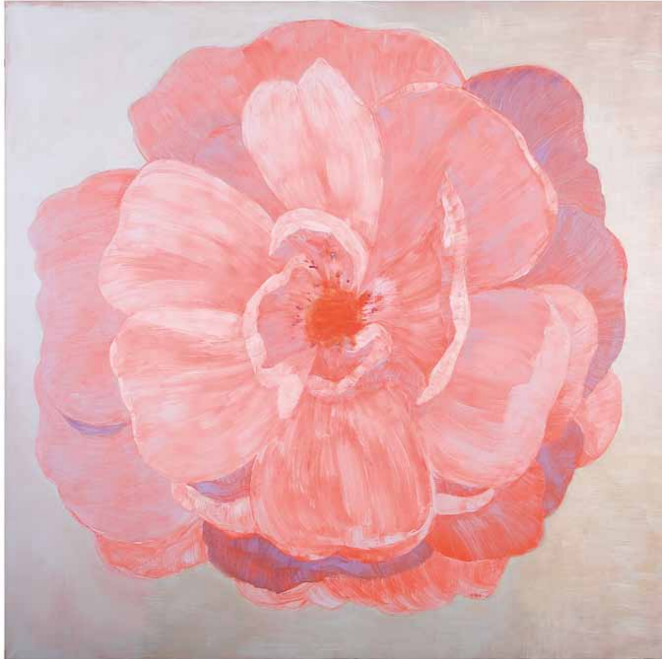
Outo kauneus Strange Beauty 2010 öljy kankaalle oil on canvas 190 x 190 cm