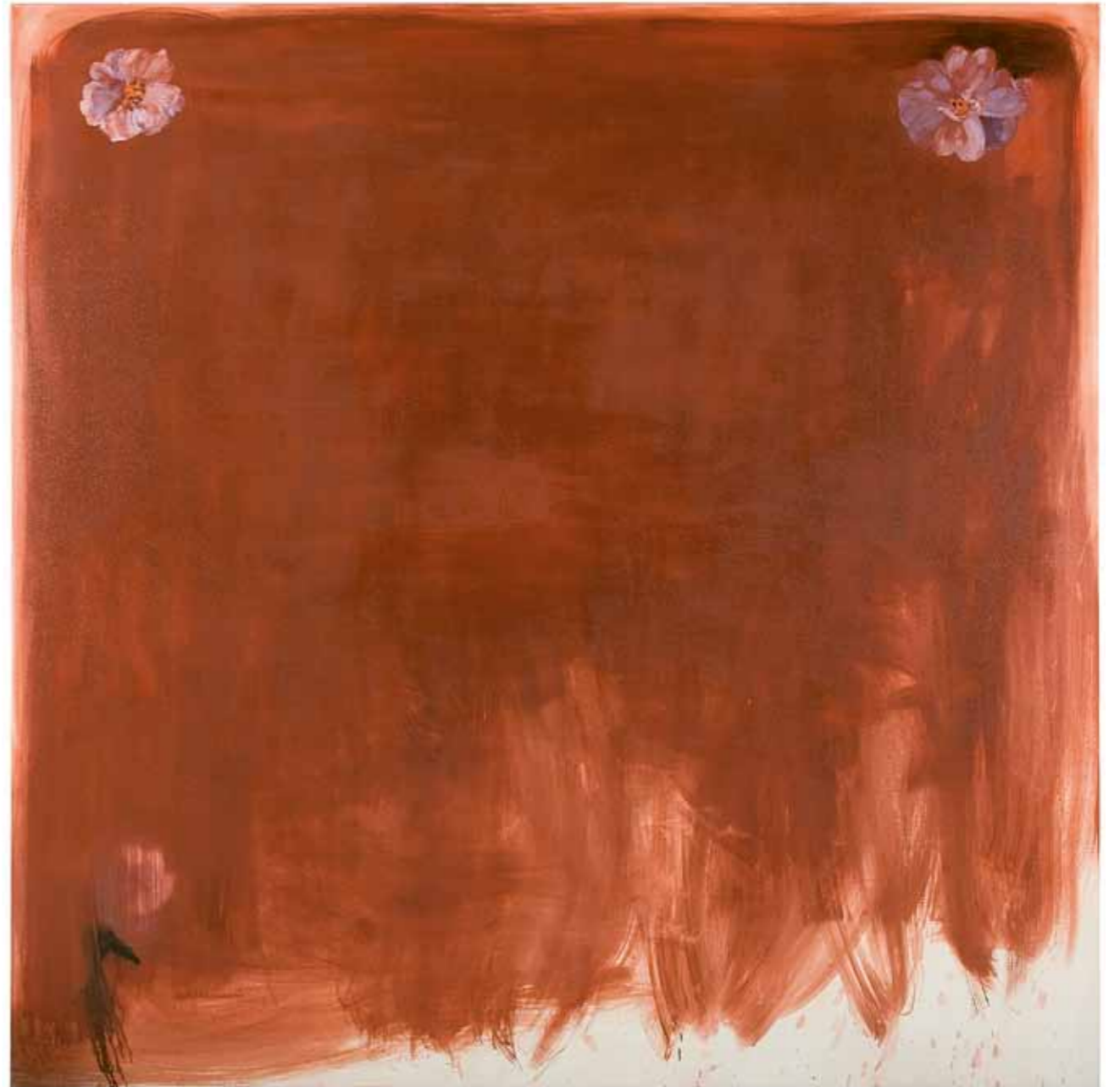
Äiti Mother 2010 öljy kankaalle oil on canvas 190 x 190 cm