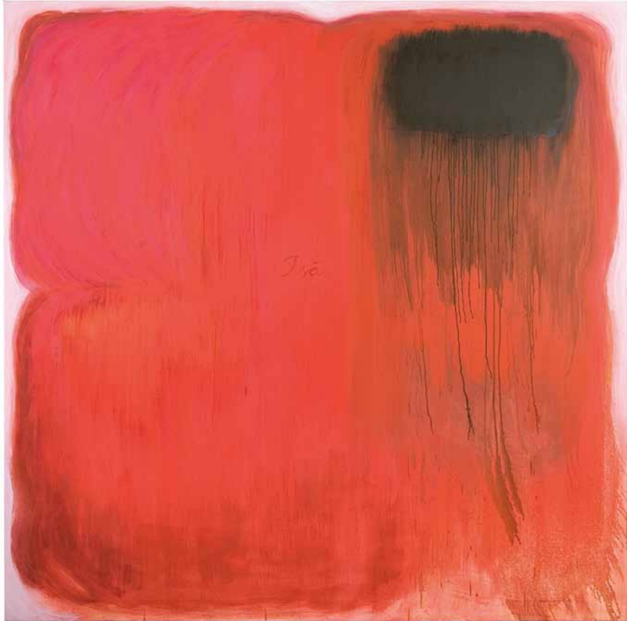
Isä Father 2010 öljy kankaalle oil on canvas 190 x 190 cm