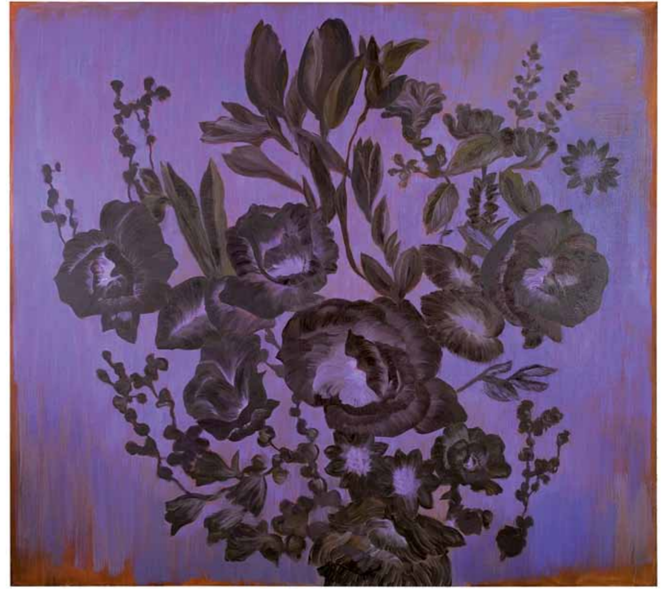
Pimeinä aikoina silmä alkaa nähdä | In a dark time, the eye begins to see 2010 | öljy kankaalle | oil on canvas | kaksiosainen | 2 parts á 200 x 220 cm