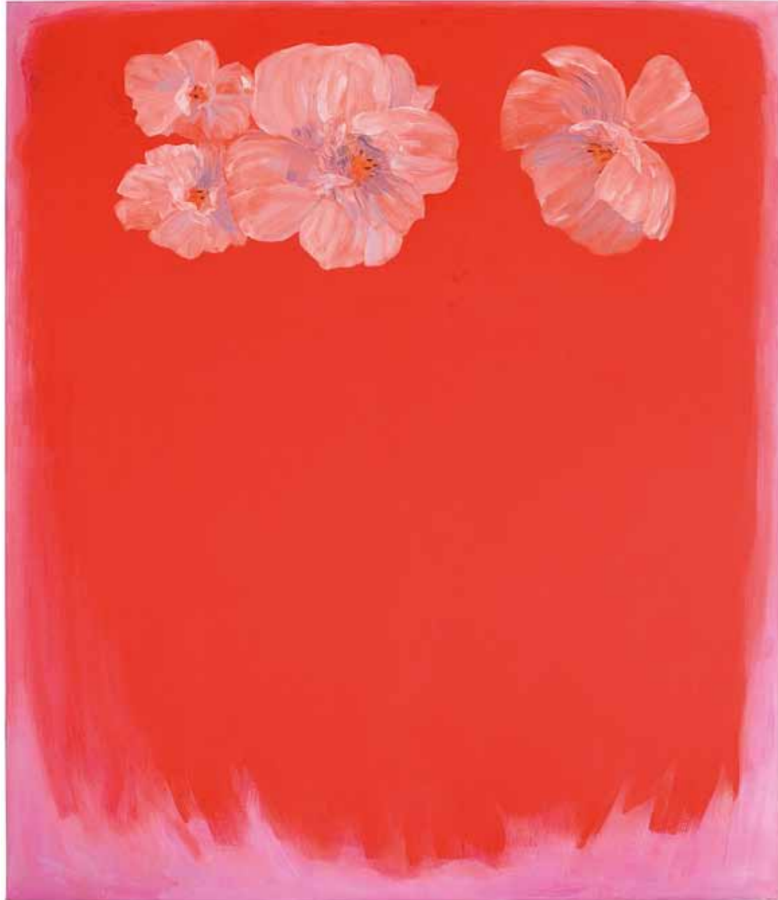
Henki jää aina kuvaan jos se niin haluaa The spirit always stays in the picture, if it wants to 2010 öljy kankaalle oil on canvas 175 x 150 cm