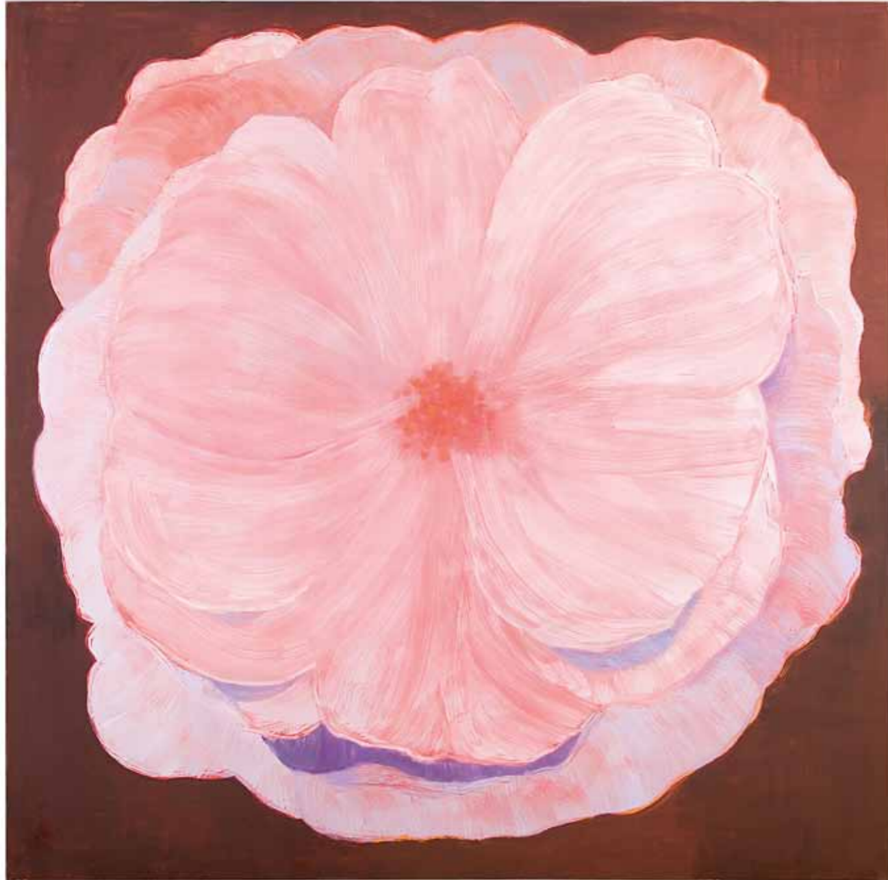
Avoinna energialle Open to energy 2010 öljy kankaalle oil on canvas 190 x 190 cm