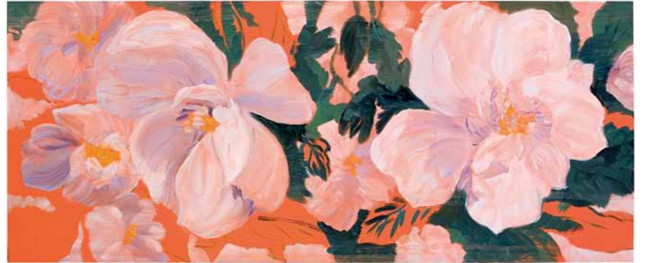
Kaksi oksaa Two branches 2010 öljy kankaalle oil on canvas 50 x 100 cm