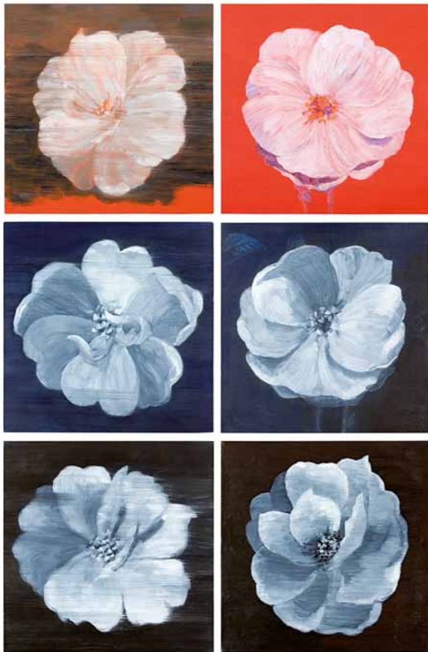
Ripoteltu sinne tänne Sprinkled here and there 2010 öljy kankaalle oil on canvas á 50 x 50 cm